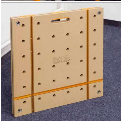
Zusammengeklappt passt die Arbeitsplatte auch in die kleinste Ecke

Bora ist eine Marke aus Amerika die seit 2023 zu OX-Tools gehört. Die Marke wird in Deutschland unter anderem von Sauter und dem dazugehörigen onlineshop „Sauter-shop“ vertrieben.