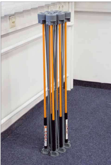
Unsere Testversion bestand aus sechs Beinen, es sind jedoch auch Gestelle mit neun bzw. Zehn, zwölf und/oder fünfzehn Beinen erhältlich