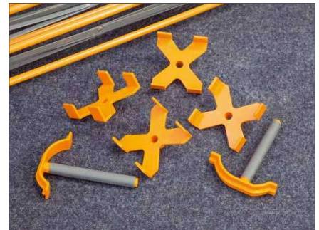
Zum Untergestell gehören zwei einfache Schnellspanner (T-förmig) und vier kreuzförmige Aufnahmen in die zum Beispiel Balken als Auflagefläche gelegt werden können