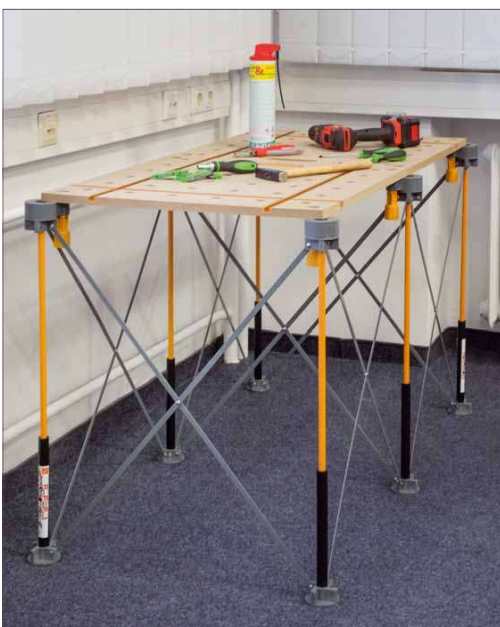
Durch seine Verstreben erreicht der Tisch eine sehr gute Stabilität