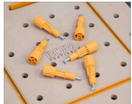
Zum Tisch gehören sechs Haltebolzen mit denen die Platte auf dem Gestell fixiert wird